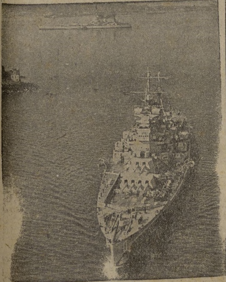
El buque británico "Duke of York", barco almirante, al saquear Portland para participar en las maniobras del Canal de Mancha antes de dividirse la escuadra para sus cruceros especiales.—(Calpe)