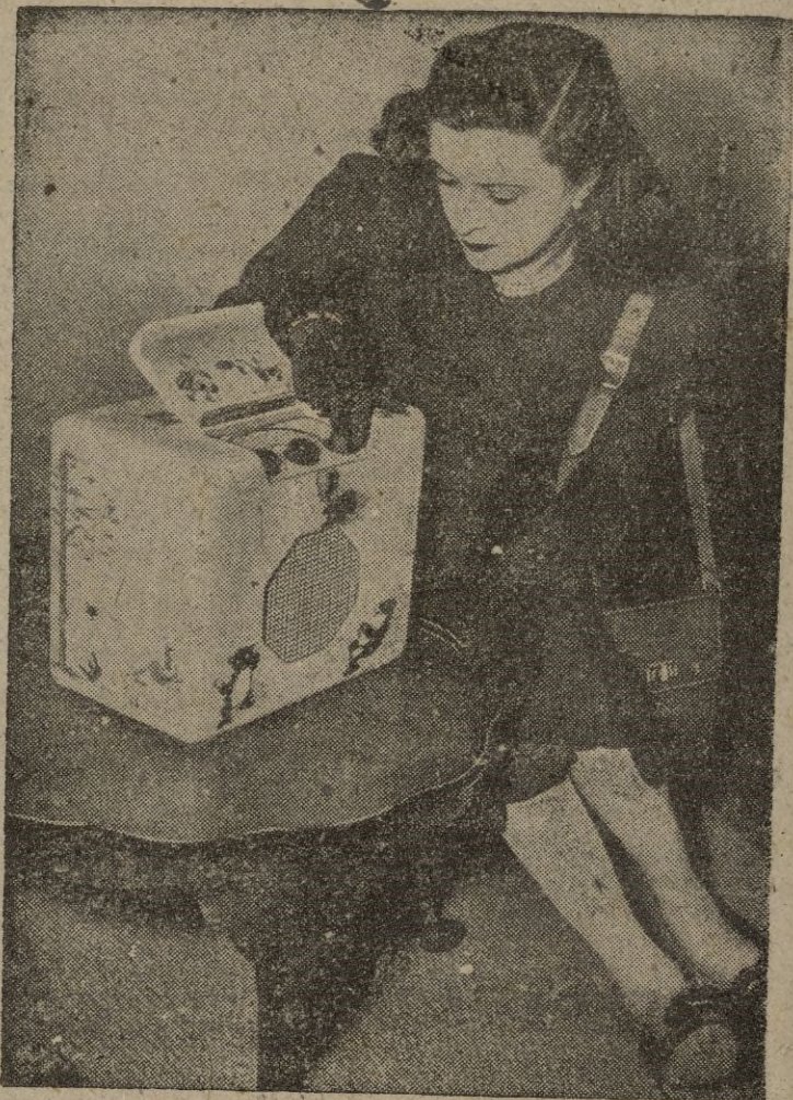
En Londres se celebró recientemente la primera Exposición Nacional de Radio, después de la guerra, en la que se presentaron todos los adelantos logrados en el curso del conflicto bélico, que son aplicables en tiempos de paz. He aquí un aparato de cuatro válvulas que funciona con batería.