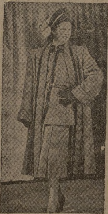
Entre los modelos lanzados actualmente en Londres figura este vestido de tres piezas de "County Kit", en color marrón y ocre diagonal, con la falda ancha, adornada con terciopelo marrón. (Colne)