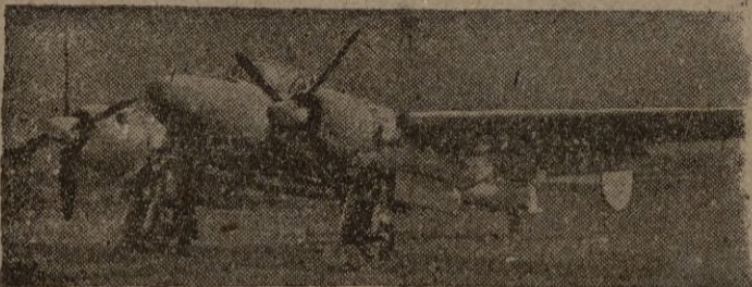
Entre los cazas, no conocidos por el público figura el "Bristol Brigand". Puede ser utilizado para bombardeos en picado. Su velocidad máxima es de 550 kilómetros, a 13.600 metros. Lleva dos cañones 4x20, un torpedo, de 1x1, de 850 libras, y ocho cohetes.