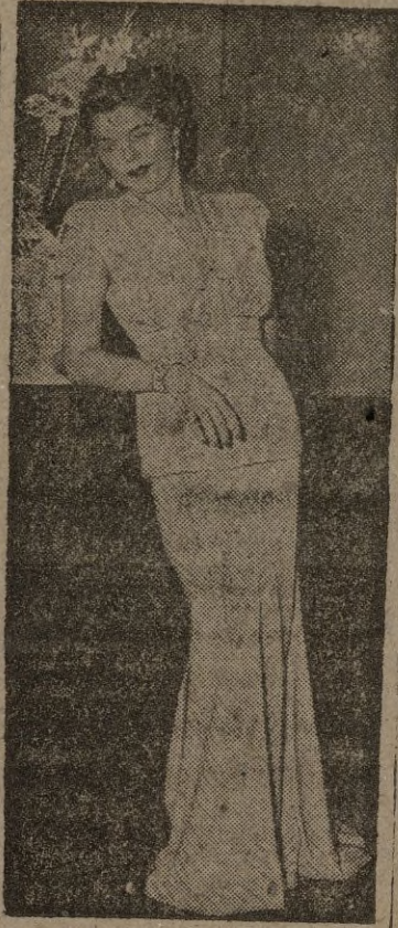
Entre las últimas creaciones presentadas en Londres figura este modelo de noche "Silver Sweep" compuesto de blusa y falda en color plata de dos tonalidades.