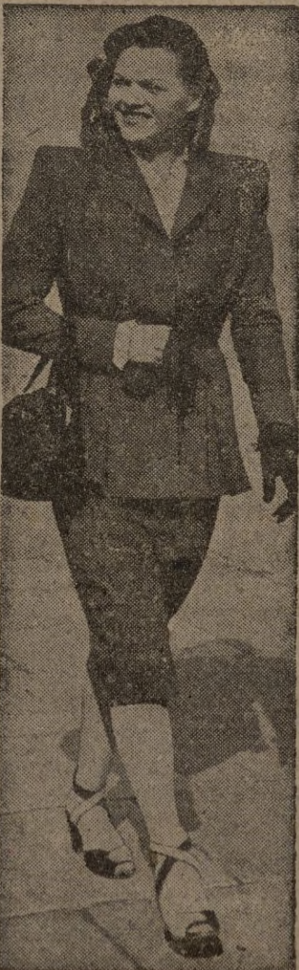
Bonito modelo en color azul indigo y sombrero de terciopelo negro, haciendo juego con el bolso y los guantes. — (Calpe).