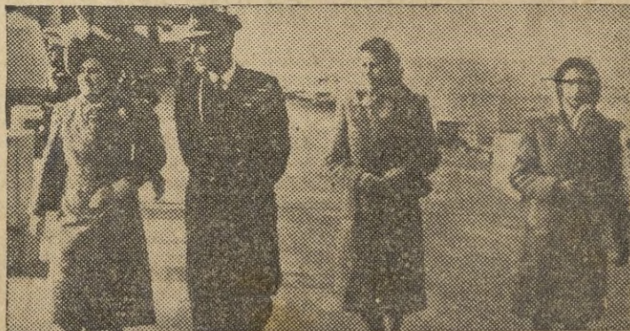
A bordo del "Vanguard", la familia real inglesa se dirige hacia Africa del Sur. En la fotografía los soberanos, acompañados de las princesas Isabel y Margaritapascan, por la cubierta del buque