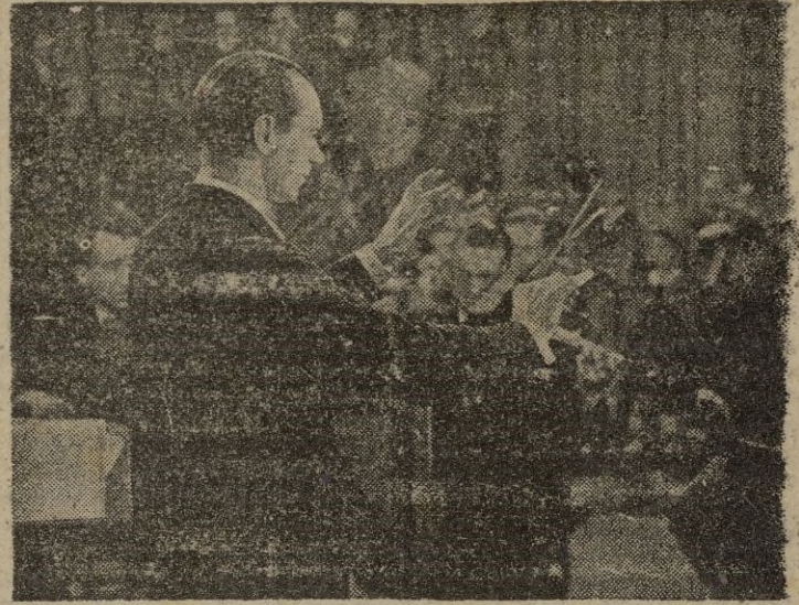
Dr. Malcolm Sargent, destacado director de orquesta británico que desde hace largo tiempo aparece en una nueva película británica llamada "Instrumentos de Orquesta". La fotografía nos muestra una escena de la película, en la que aparece el director de orquesta Dr. Malcolm Sargent

Todo está con nosotros, razón, justicia, soberanía y orden social. Para mantener estos principios has de votar apoyando la Ley de Sucesión a la Jefatura del Estado que es el mantenimiento, la continuidad de nuestra obra hasta que se nos considere en la balanza internacional con el peso de nuestros derechos y de la verdad de España.