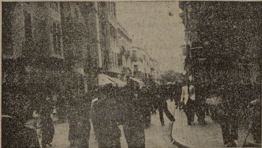
Calle del Generalísimo Franco, la arteria principal de la ciudad con sus magníficos edificios y comercios suntuosos, llena, plétórica de fé y de vida...

Avenida Sidi Dris TETUAN (Marruecos) Teléfonos, 3466 - 3579