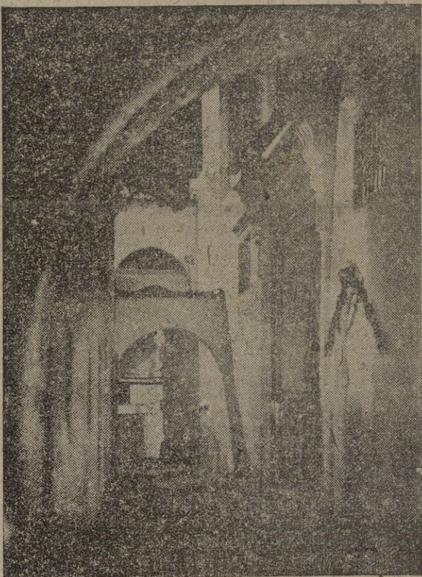
Y en contraste con ésta vía, la Medina ofrece estos rincones, silenciosos, indolentes, por los que la vida parece no transcurre, remanso de luchas y de afanes y bajo cuyos arcos algún creyente musita, lenta y pausadamente, versículos del Korán...

DIA 31.—(Ultimo día de Feria). Espectáculos y Atracciones. Gran verbena. Velada de boxeo. Traca final.