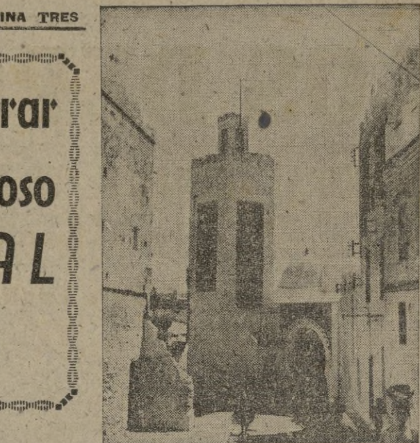
Y ya cerca de las antiguas murallas, se alza, entre cien más, la airosa torre de la Mezquita de Sidi Saidi, no lejos de las torretas del Borch, donde hace siglos os vigías daban la señal de alarma, a la vista del enemigo...

DIAS 28, 29 y 30.—Atracciones, Espectáculos. Conciertos musical e Clausura de la Exposición de Artesanía Marroquí.