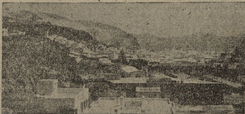
Al pie de su vieja Alcazaba la ciudad se extiende y crece con éstas modernas construcciones que forman parte de una de sus populosas barriadas...