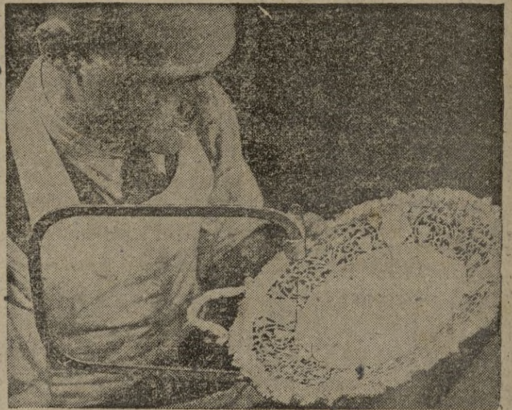
Los artifices de Sheffield tratan de mantener su supremacía en el mundo. Véase un calador trabajando en una de sus complicadas labores.—(Calpe).