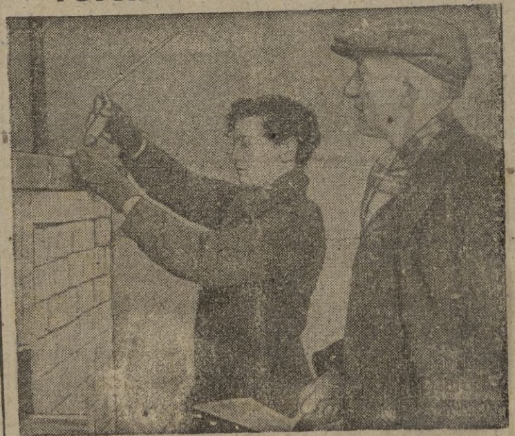
Bajo la dirección de técnicos reciben enseñanza para convertirse en los futuros constructores de casas. En la foto se ve a un chico aprendiendo a nivelar el remate de una chimenea.