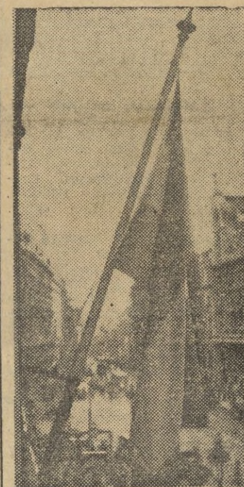
Madrid. — La bandera nacional boliviana izada en la Legación de Bolivia con motivo de la reanudación de las relaciones diplomáticas entre ambas naciones

Relaciones diplomáticas entre España y Bolivia