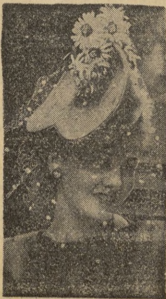
Boina fantasía, en fieltro verde adornada con margaritas amarillas y blancas.