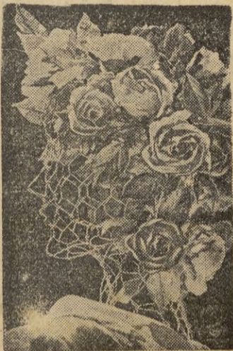
Un ramo de rosas; he aquí un sombrero ideal.

Las flores y los tules en pro- fusión. He aquí otros adornos de posibilidades inagotables para confeccionar un sombrero o un tocado de noche. Las margaritas, las rosas, las violetas y hasta las variadas orquídeas, al lado de los humildes alfileres y de las campanillas, forman verda- deros ramos cubriendo toda la cabeza, cayendo sobre un lado o poniendo una nota delicada y casi perfumada, a fuerza de perfección en la línea y el co- lorido, sobre una verdadera cas- cada de tul que en los som- breros de tarde vela suavemen- te la cara.