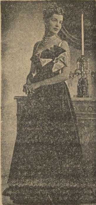
La artista británica Valerie Hobson luce un elegante modelo de noche en terciopelo negro.

Las lentejuelas gozan de gran- des posibilidades tanto para los tocados de noche como para los de tarde. Un cintillo confeccio- nado con una ancha cinta de terciopelo plegada y adornado con lentejuelas, sirviéndole de remate un pompón, resulta ideal para la tarde. Un tul dra- peado, en color pastel por ejem- plo, puede constituir si se sabe colocar con gracia, con sus largas puntas salpicadas de len- tejuelas y un doble círculo de ellas en la coronilla.