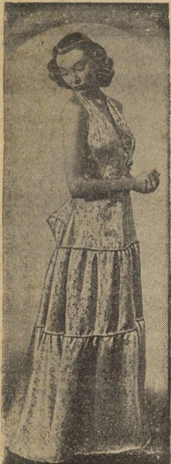
Un modelo en Bianca Mosca, en seda "Veta de Mármol".

La moda actual se caracteriza por la variedad de ideas que los modistos londinenses expre- san en formas totalmente dispa- res, con la ventaja indiscutible de satisfacer todos los gustos, desde los más extravagantes hasta los más sencillos. En ge- neral, predominan los escotes algo exagerados y la ausencia de mangas, en los modelos des- tinados a las señoras. Para las jovencitas continúan lleván- dose los estilos discretos con mangas cortas y pequeños es- cotes, confeccionados en lindos organdís bordados o estampados de tonos delicados.