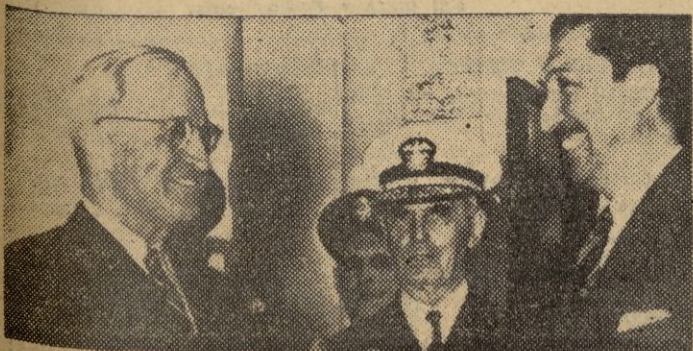
WASHINGTON.—El presidente de Méjico, Miguel Alemán, en su reciente visita a los EE. UU., es recibido en la Casa Blanca por el presidente Truman.