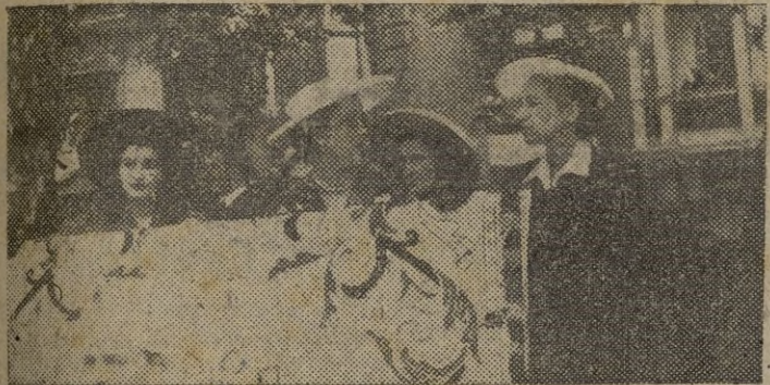
BARCELONA.—La esposa e hija del Jefe del Estado presencian desde la tribuna el gran desfile militar celebrado con motivo del triunfal viaje del Caudillo