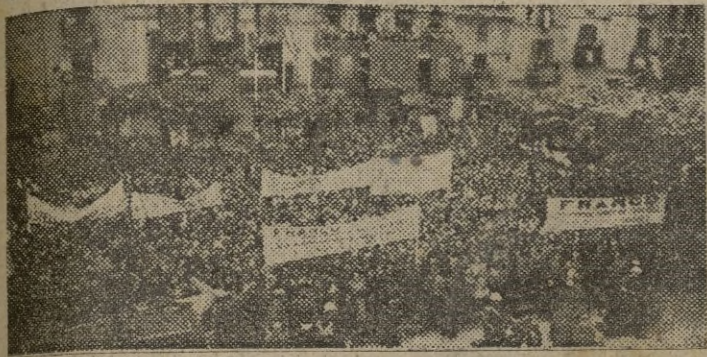
SABADELL.—El pueblo de Sabadell, reunido en la Plaza del Ayuntamiento para aclamar a Su Excelencia el Jefe del Estado

Todos los pueblos del trayecto expresaron al Generalísimo SU INQUEBRANTABLE ADHESION