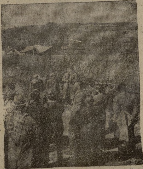
El país de Gales, con el fin de intensificar la producción de campo se realizan cursos para estudiantes, los después de un entrenamiento se convierten en futuros granjeros.

UNDERWOOD Academia de Mecanografía Almacén de música PRECIOS ECONOMICOS M. Fernández Benítez S. L.