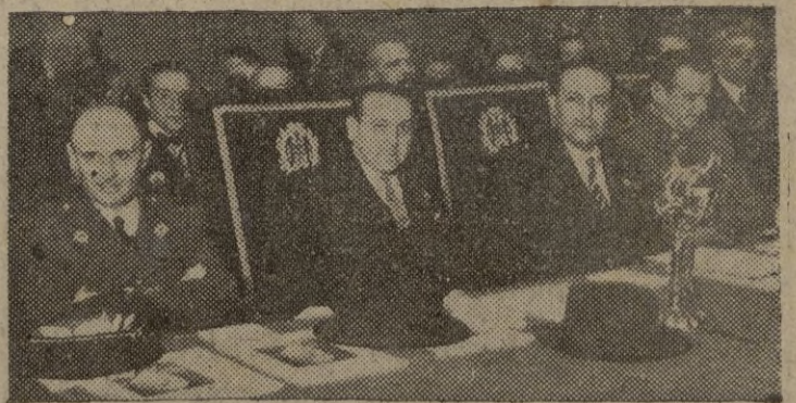
MADRID. — En nombre del Caudillo, el ministro de la Gobernación, Excmo. señor don Blas Pérez González, inaugura el IV Congreso Nacional de Sanidad Municipal, celebrado en el cine Capitol de esta Ciudad. En la foto vemos un aspecto de la mesa presidencial del acto.