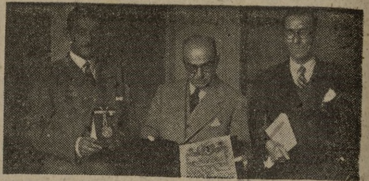
MADRID.—Los miembros de la Comisión de Vitoria que se trasladó a Roma para entregar al Santo Padre la primera Medalla de Oro «Francisco de Vitoria», muestran dicha condecoración y el pergamino dedicatoria a su paso por Madrid.

La primera medalla de oro «Francisco de Vitoria» para Su Santidad el Papa