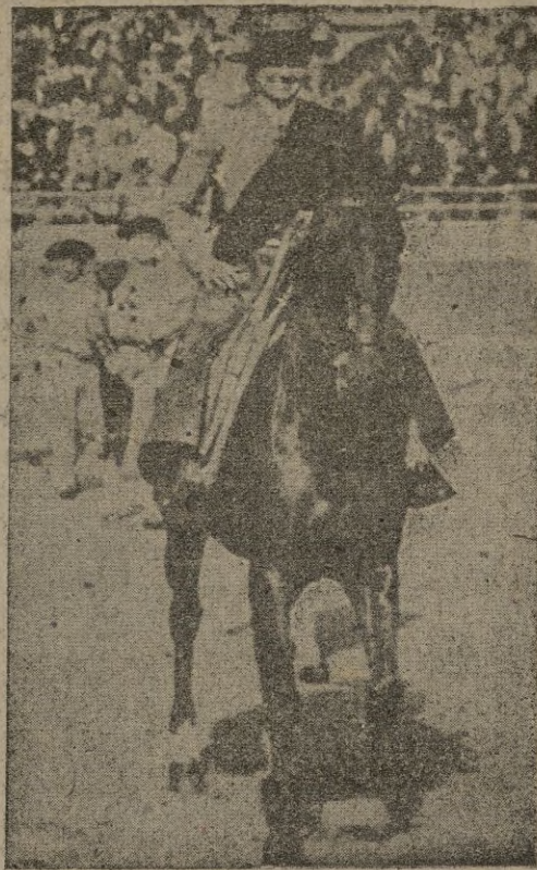
La gentil amazona y bellísima REJONEADORA ESPAÑOLA, única por su arte y soberano estilo, que hará su presentación en la Plaza de Toros de Ceuta el domingo día 23 en la gran corrida de Beneficencia patrocinada por el Excmo. Señor Delegado Gubernativo.

La mesa electoral estuvo presidida por el secretario del Sin-