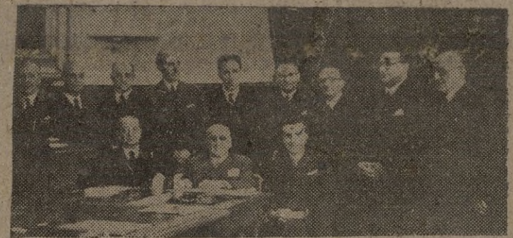
MADRID. — Los rectores de las Universidades de toda España reunidos en el Palacio de las Cortes, para designar su representante en el Consejo del Reino.