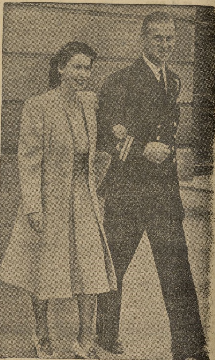
El teniente Felipe de Mountbatten, prometido de la princesa he- redera, Isabel de Inglaterra, ha ingresado en la iglesia anglica- na, en una ceremonia que se efectuó en la capilla del palacio de Lambeth, en la que ofició el arzobispo de Canterbury. Con motivo del compromiso matrimonial se han publicado incontables fotografías de la egregia pareja. He aquí la última, que hasta ahora, es la mejor

Polvos tocador Pompeya Perfumería Vicente Martínez