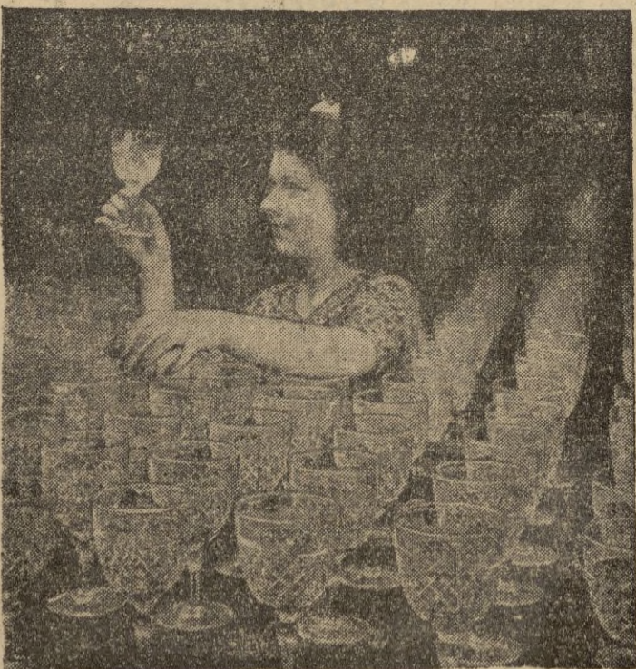
En Storbidge (Worcester), se fabrica una de las cristalerías más finas del mundo. Apresionada entre las copas vemos a esta operaria examinando el magnífico cristal antes de embalarlo.