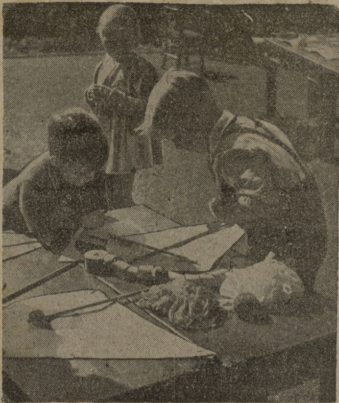
La nueva Ley de Educación en Gran Bretaña exige que cada niño habrá de recibir la enseñanza más adaptable a su edad y a sus aptitudes. Estos pequeños ingleses, al aire libre, se divierten mientras se instruyen.