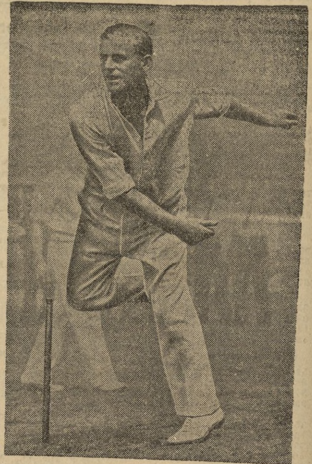
El teniente Felipe Mountbatten, futuro consorte de la princesa Isabel, se entrega a los deportes con entusiasmo cuando su puesto de oficial instructor de la Marina le deja ratos libres