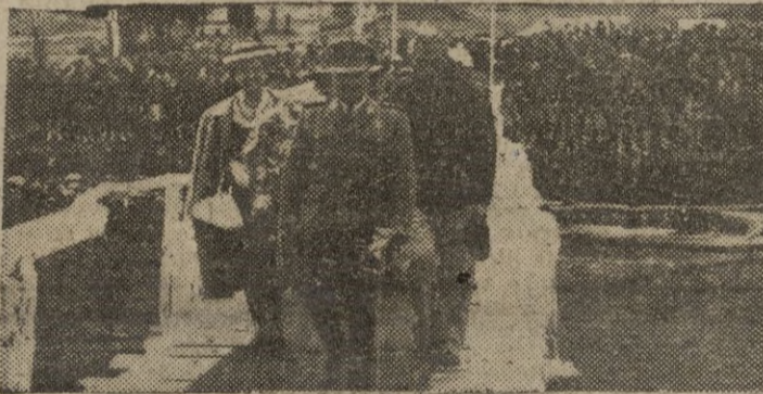
LEON. — S. E. el Jefe del Estado, acompañado de su esposa y del delegado nacional del Frente de Juventudes, durante su visita al campamento establecido en Riaño