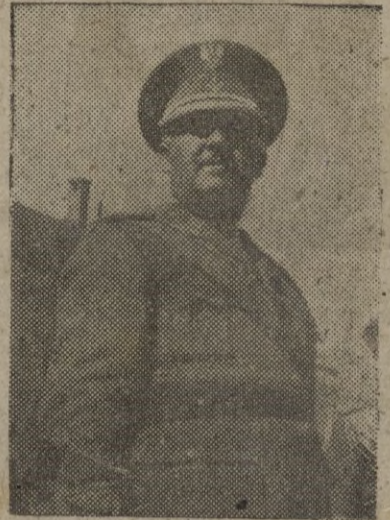
FRANCO, el primer legionario

Un desmentido del Departamento DE ESTADO NORTEAMERICANO