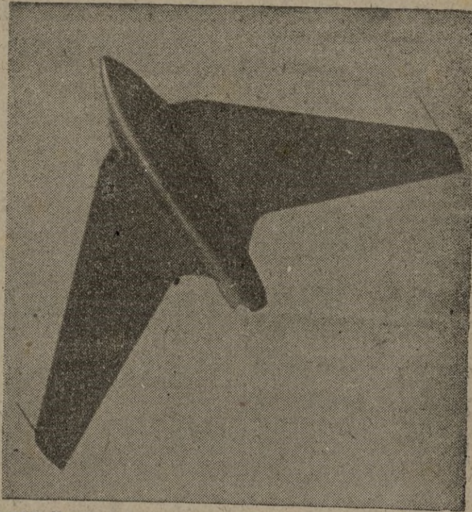
La casa Havilland realiza pruebas del nuevo aparato de propul- sion por reaccion "Swallow". El avión en pleno vuelo.