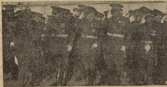
A su llegada al puerto de La Coruña para presenciar las regatas de balandros y traineras, el Jefe del Estado saluda a las autoridades que acudieron a cumplimentarle