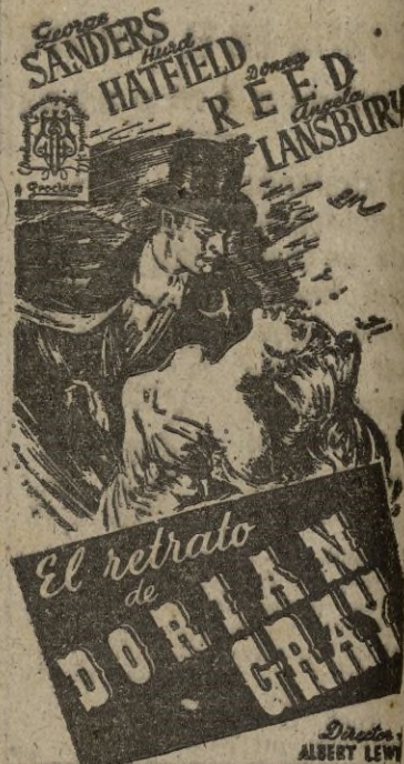
SEGUN LA NOVELA DE OSCAR WILDE

Producida por una marca gloriosa y presentada por Prochinos, ofrecemos a ustedes una de las más grandes obras del famoso OSCAR WILDE que al ser llevada al cine se ha convertido en una de las películas más discutidas del año.