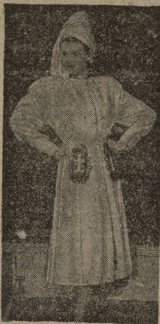
Abrigo blanco de entretemplo, con bolsillos de fantasía, color tabaco. Turbante de jersey, estilo ruso.