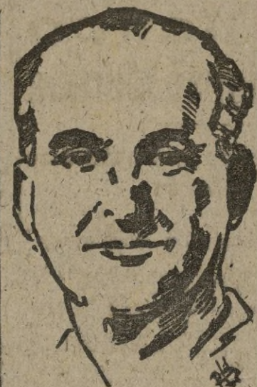
su estancia en Ceuta les haya sido muy grata.

Reciba tan ilustres visitantes nuestro respetuoso y cordial saludo de bienvenida, deseando que