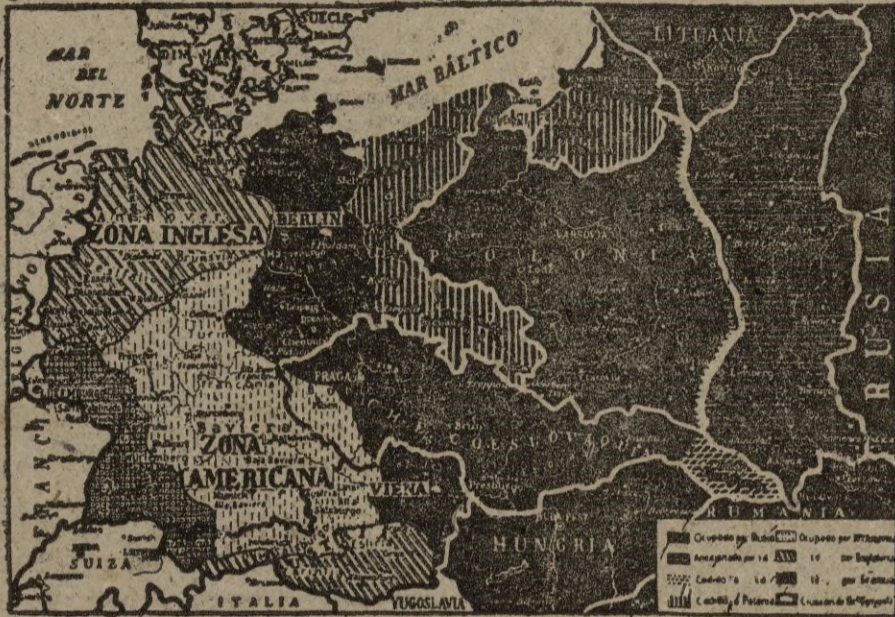
Esto es el escenario de las nuevas discordias entre el gigante ruso y sus antiguos aliados occidentales. La tensión está llegando al máximo con las injustificadas medidas de control soviéticas. Tanto Inglaterra como Estados Unidos y Francia han manifestado su decidido propósito de no abandonar Berlín, en contra de los deseos rusos. ¿Será esta la chispa que encienda el barril? ¿O simplemente un episodio más de la actual guerra de nervios

Se cree que este sea el último servicio aéreo de esta naturaleza, pues el servicio ferroviario se reanuda próximamente, según opinan círculos bien informados.—EFE.