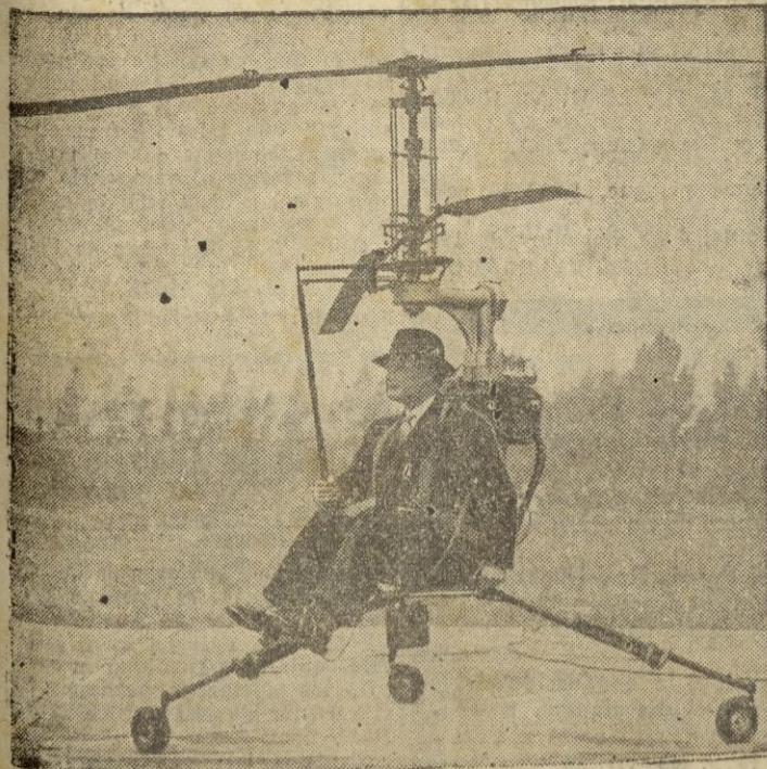
Helicóptero personal que permite alcanzar una velocidad de cruce ro a 65 a 90 kilómetros por hora, transportando un peso de 75 kilómetros.—(Calpe).