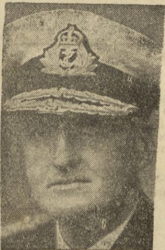
El almirante Fraser, nuevo Lord del Mar, cargo en el que sustituye al almirante sir John Cunningham.