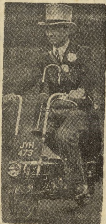
Esta motocicleta modernísima, es una adaptación de las usadas por los paracaidistas durante la guerra. El manillar es plegable y por esta razón ocupa un mínimo espacio.

discursos del Benelux y de los de Beigault, ni mucha menos los gritos de los emboscados del soviético.