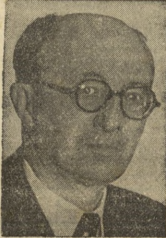
Sir Francis Campbell Ross Douglas, gobernador y comandante en jefe de Malta, desde 1946. Es la segunda personalidad civil que ha ocupado el cargo en el transcurso de un siglo.

Un movimiento revolucionario en Venezuela puede incluso, como ustedes ven, devaluar una intervenció periclitada lograda a ocho mil kilómetros.