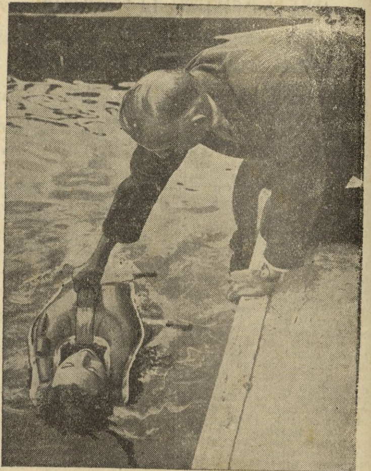
Pruebas de un nuevo salvavidas individual que coloca al naufrago «boca arriba» (Calpe)