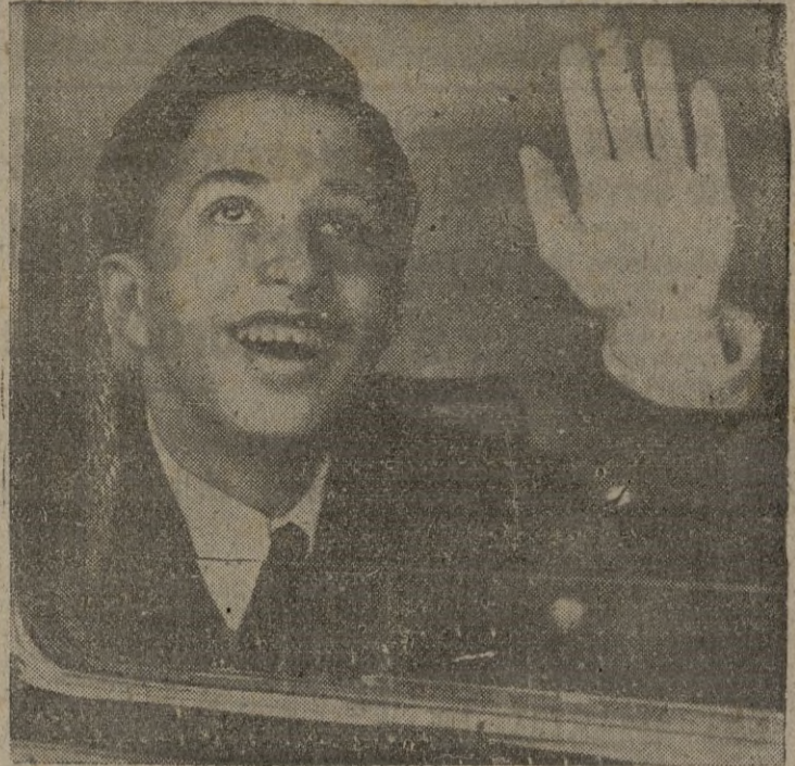
El rey Feisal, del Iraq, que es el monarca más joven de todo el mundo, recientemente estuvo en Londres. En la foto se despide desde el coche, de sus compañeros de viaje.