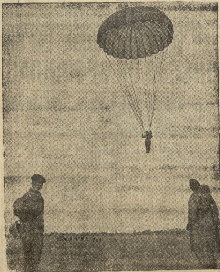
Los británicos instruyen a sus fuerzas aerotransportadas, empleando en este entrenamiento nuevos modelos de materiales y equipos que garantizan una extraordinaria seguridad, especialmente para el salto en paracaídas.—(Calpe).