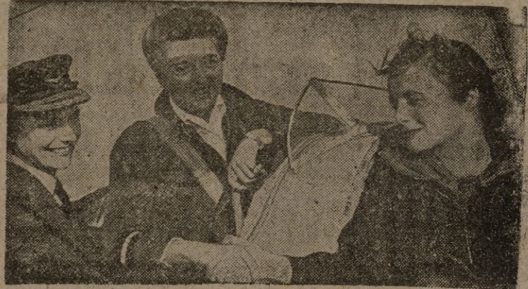
Las mujeres británicas que tengan la preparación debida pueden entrar a formar parte del nuevo Cuerpo Auxiliar de Reserva de pilotos femeninos. He aquí a la directora de dichas Fuerzas Femeninas del Aire felicitando a una nueva admitida.—(Calpe).