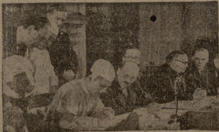
Hace pocos días fué proclamada la independencia de Birmania. La firma del Tratado que hace de aquel país un Estado libre se verificó semanas antes en Londres. En la foto aparecen Mr. Attlee y varios ministros británicos y el representante de Birmania, Thakin Nu, primer ministro, en el acto de la firma.