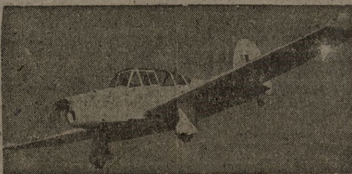
Avión de entrenamiento

El "Percival Prentice", nuevo avión de entrenamiento, es capaz de soportar diez veces su propio peso. Este monomotor de ala baja está fabricándose en serie.