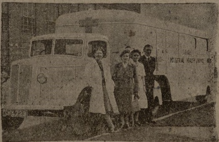
Para el mejor servicio de los obreros, hoy se utilizan hospitales ambulantes, que pueden ir de fábrica en fábrica, con todos los elementos de un hospital fijo, y que ahorran muchas horas de trabajo.—(Galpe)

En la región de Nápoles también ha terminado la huelga de 20.000 campesinos, después de un acuerdo conseguido con los propietarios, que han firmado un nuevo contrato de trabajo.