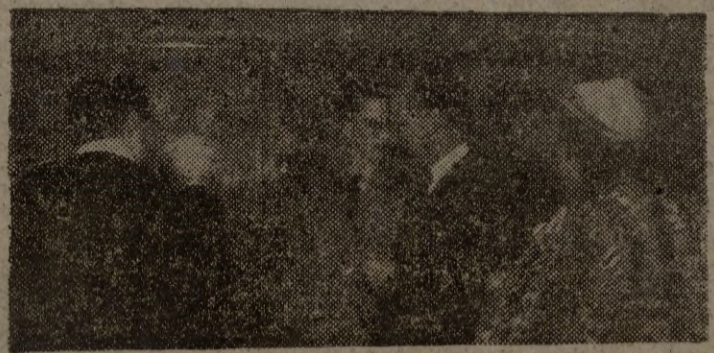
AEROPUERTO DE BARAJAS.—El rey Leopoldo III de Bélgica, acompañado de su esposa, la princesa de Rethy, y de sus hijos, descansa unos momentos en el aeropuerto de Barajas, durante su viaje desde Suiza, donde permanece en exilio, para Lisboa