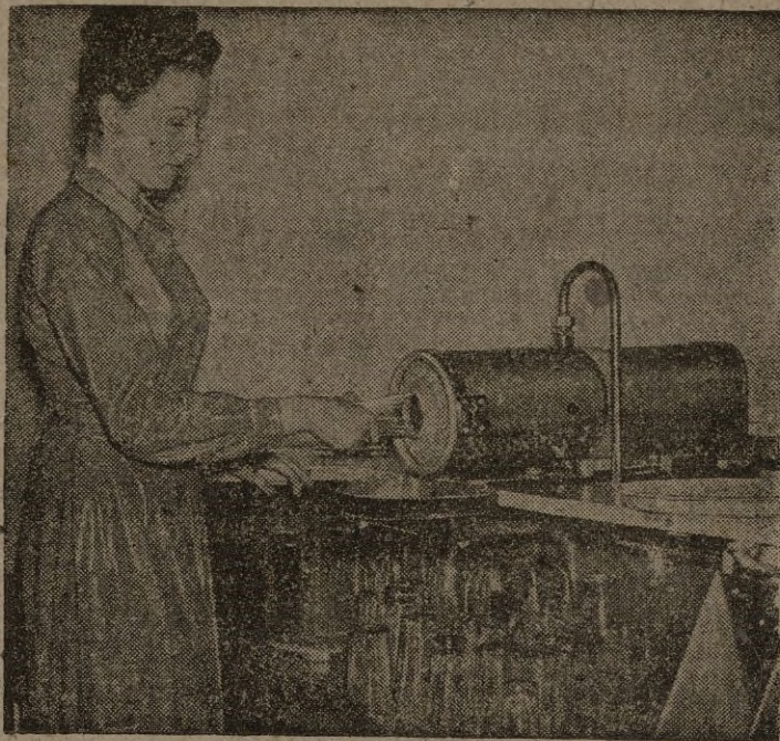
Entre los diversos artículos exhibidos en la Exposición de la Industria cervecera, figura este aparato que puede limpiar mil vasos en una hora.—(Galpe).