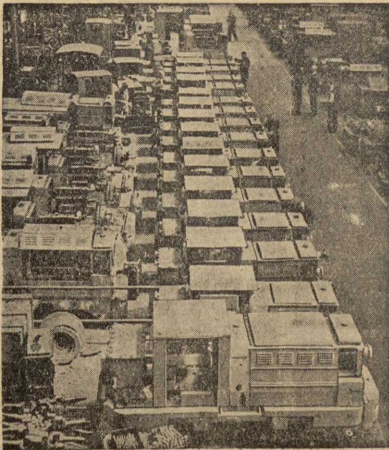
Destinadas a las minas se fabrican locomotoras Diesel con un escape especial que no produce humos que puedan poner en peligro la seguridad del personal que trabaja en las galerías. — (Calpe)