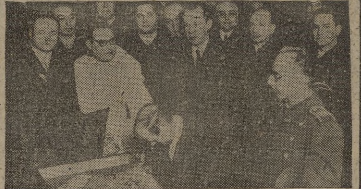
Los ilustres huéspedes argentinos durante su estancia en Zaragoza.