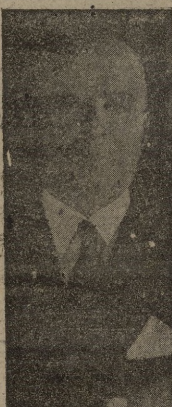
Señaló a su ilustre esposo en su visita de ayer a Ceuta. Poco después, SS. EE. y acompañantes emprendieron viaje de regreso a Tetuán.

Ambas representaciones ofrecieron después sus respetos a la Excmo. Sra. de Varela, que acom-