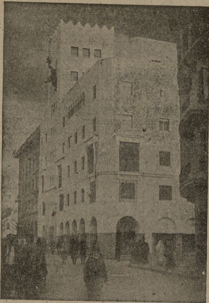
Fachada del magnífico edificio desde la calle del Generalísimo

al viento las banderas española y marroquí.