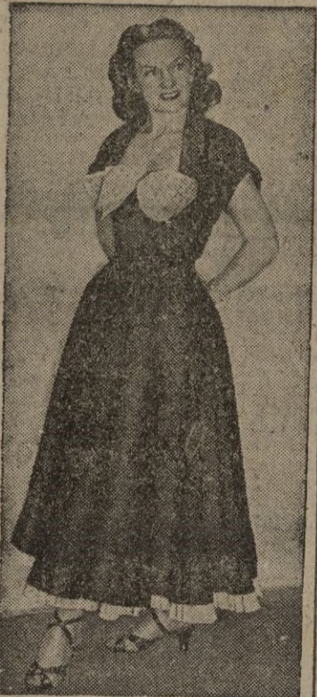
El Secretariado Internacional de la Lana ha organizado en Londres una exposición de modas con desfile de modelos como éste de la foto.