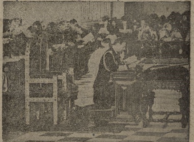
SS. MM. los reyes de Inglaterra en sus bodas de plata