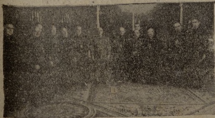
EL PARDO.—Los abades de la Orden Benedictina, presididos por su primado, complimentan al jefe del Estado, quien expresó la satisfacción que experimentaban al saludar a los abades de una Orden unida a nuestra nación por tantos lazos de cariño, afecto y gratitud.