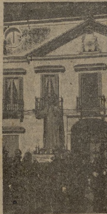
MADRID. — El Caudillo y su esposa presencian el paso de la procesión con la imagen del Sagrado Corazón de Jesús, desde el balcón central del Palacio

Donación de una imagen del Sagrado Corazón de Jesús a la Iglesia Parroquial de El Pardo, por la esposa de S. E. el Jefe del Estado