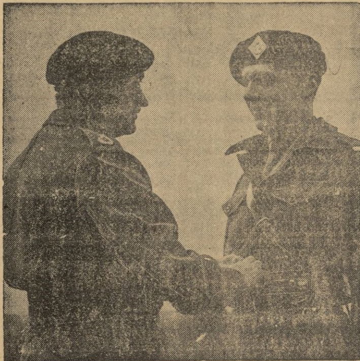
El mariscal Montgomery condecora a su hijo Bernardo, de las Reales Fuerzas blindadas.—(Galpe).