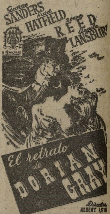
SEGUN LA NOVELA DE OSCAR WILDE

Producida por una marca gloriosa y presentada por Procinca, ofrecemos a ustedes una de las más geniales obras del famoso OSCAR WILDE que al ser llevada al cine se ha convertido en una de las películas más discutidas del año.