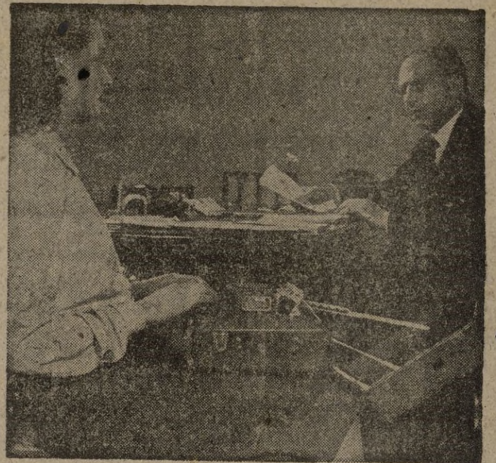
Máquina de escribir con signos taquigráficos, que permite alcanzar una velocidad de 200 palabras, con un aprendizaje de poco más de un año.