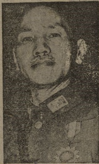
fué en otro tiempo el más acérrimo adversario de Chang Kai Chek.

El generalísimo cuenta 62 años de edad. Li Sung-Yend, de 51,