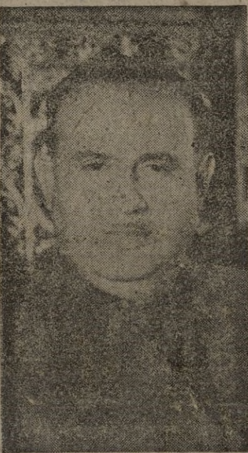
(Vea información en página 6)