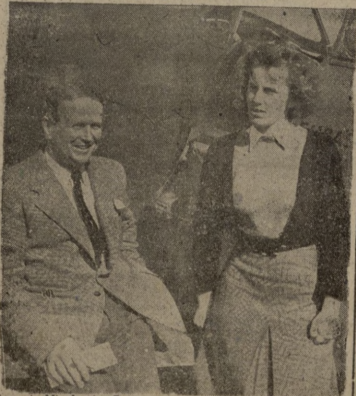
Le aquí a Miss Lettice Curtis, nueva campeona, que acaba de batir record mundial femenino de vuelo en circuito cerrado de 100 kilómetros.