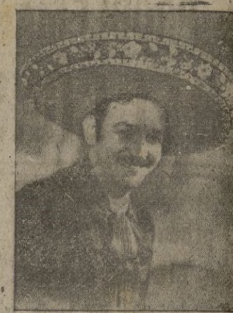
El famoso actor de cine y popular cantante.

¡Acontecimiento! ¡Solo por un día! ¡El idolo de las multitudes en su actuación personal!