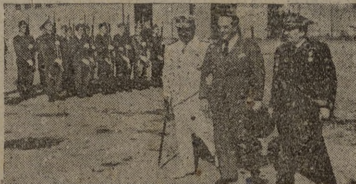
La misión peruana en el Centenario de la Marina de Castilla